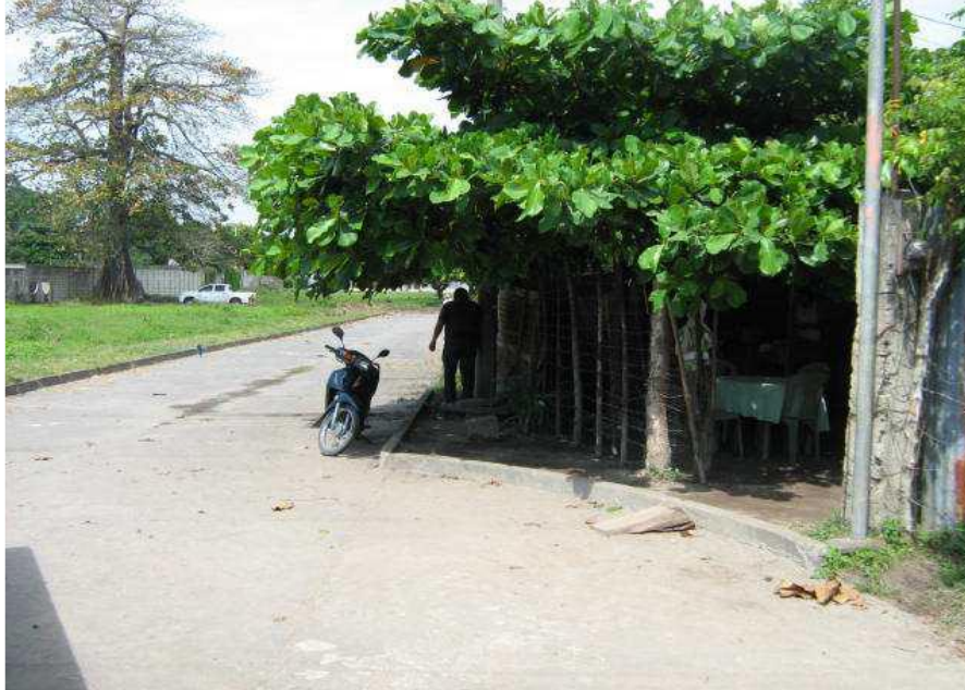
FRENTE AL INMUEBLE